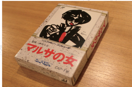
「マルサの女」ファミコンソフト

収蔵庫にて。真っ先に見付けて「あ! これはヤバいです! 当時欲しかったヤツ!!!」——満面の、弾ける笑みを頂戴しました。脱税摘発RPGのファミコンソフトです。こういう時、人は時空を軽々と超えますね。