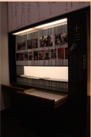
「映画監督」のコーナー

H (インタビュー風の映画撮影日記の直筆原稿を見て) 聞き手の方のお名前が「文春の人」というのがいいですね。