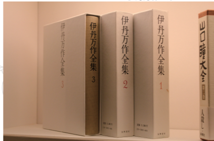
伊丹万作全集レタリング

「これ、ステキですね...」(しみじみと、ポツリ)——父の全集に息子が寄せた題字レタリングは伊丹十三のデザインワークの代表作です。「伊丹十三記念館」のロゴマークは、この「伊丹明朝」を元にして作られているんですよ。